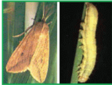
শীষকাটা লেদা পোকা