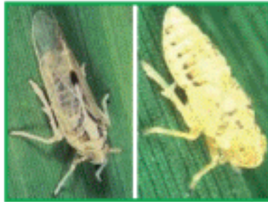
সাদাপিঠ গাছ ফড়িং