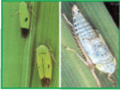
সবুজ পাতা ফড়িং