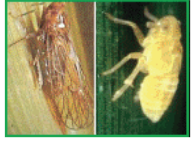
বাদামী গাছ ফড়িং