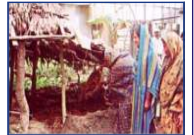
চিত্র: গোবর সংরক্ষণ পদ্ধতি

জৈব সার জ্বালানি হিসাবে ব্যবহার করবেন না