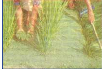
চিত্র: এ্যাজোলা প্রয়োগ